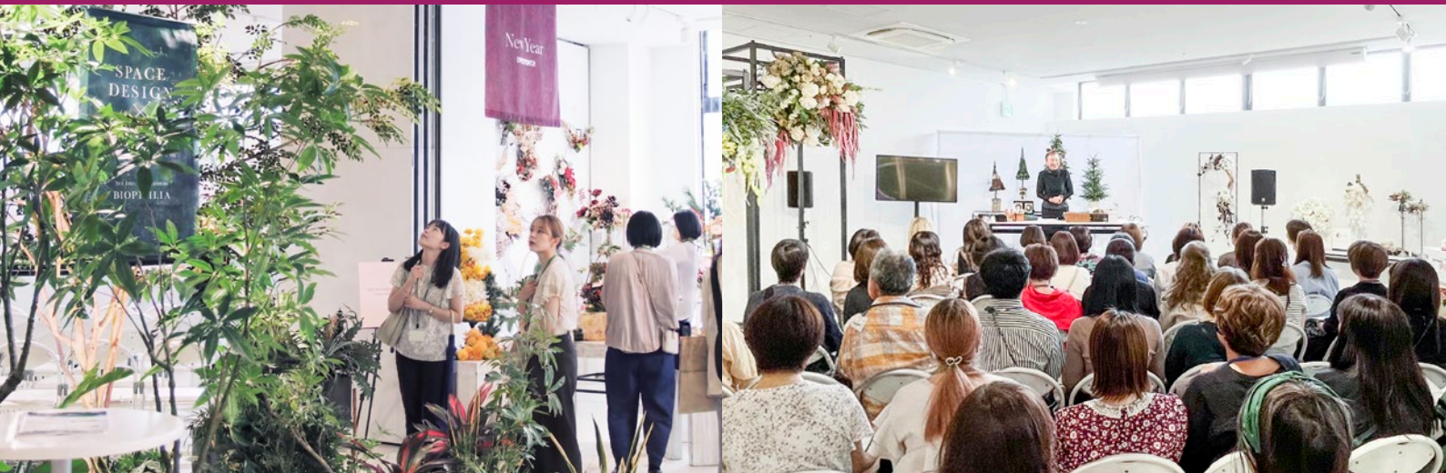
写真は昨年開催時の様子